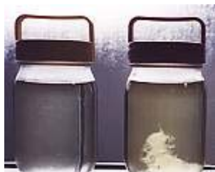
微生物的产生——菌团的照片 “水之魂”投入第3个月